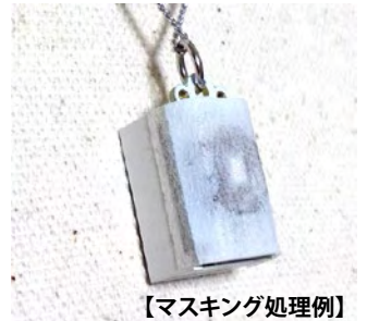
【マスキング処理例】