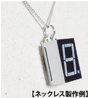
【ネックレス製作例】