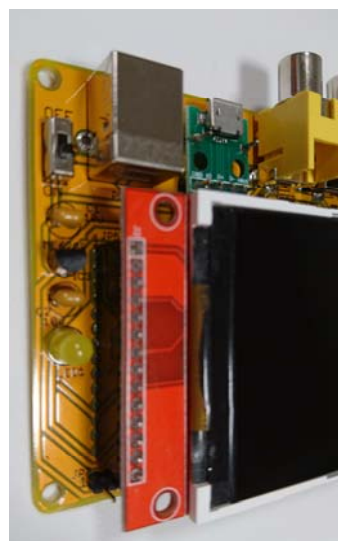
2.8 インチ TFT 液晶モジュール