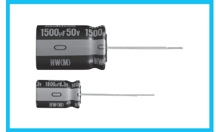
スリーブ色：ブラック